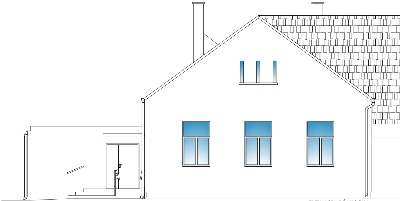
ELEWACJA PÓŁNOCNA (frontowa)